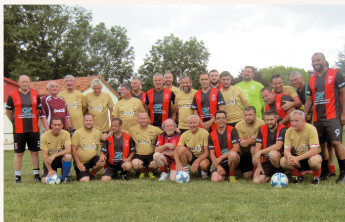
Des anciens plus ou moins jeunes, que de souvenirs !