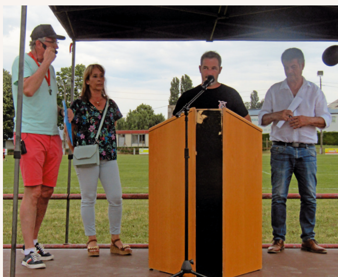
Les discours officiels