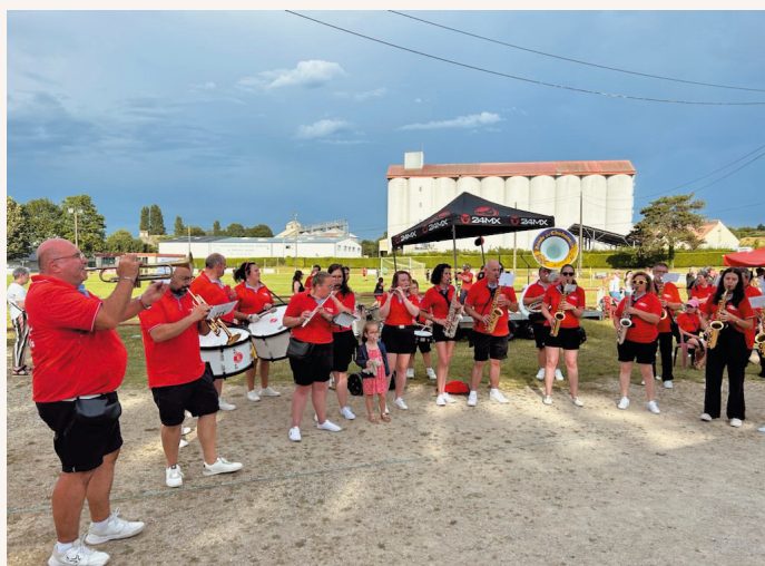
La banda de Chabanais