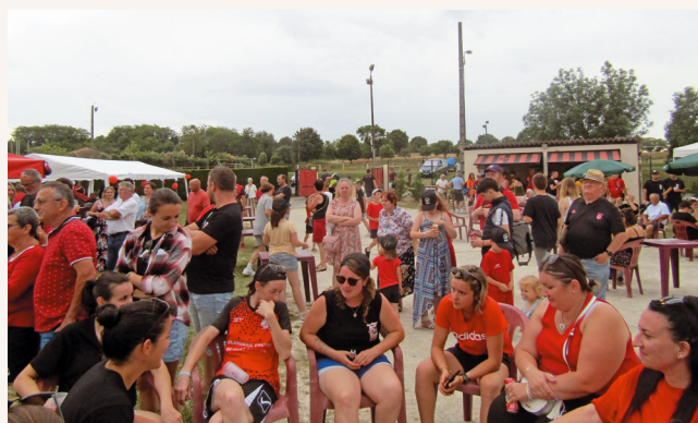
De nombreux supporters