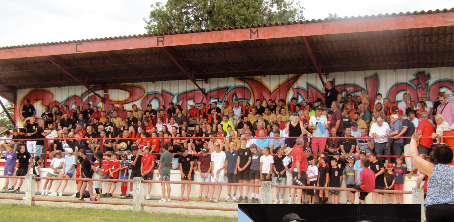
Les Coqs Rouges réunis dans la tribune